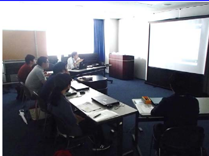
広島西部山系砂防事務所の取組 (広島西部山系直轄砂防事業・小規模砂防堰堤について)