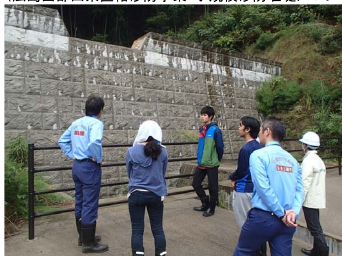
現場視察(大町地区) —小規模溪流対応型砂防堰堤—