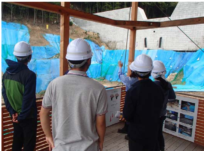
現場視察(八木地区) —H26. 8. 20広島土砂災害復旧現場—