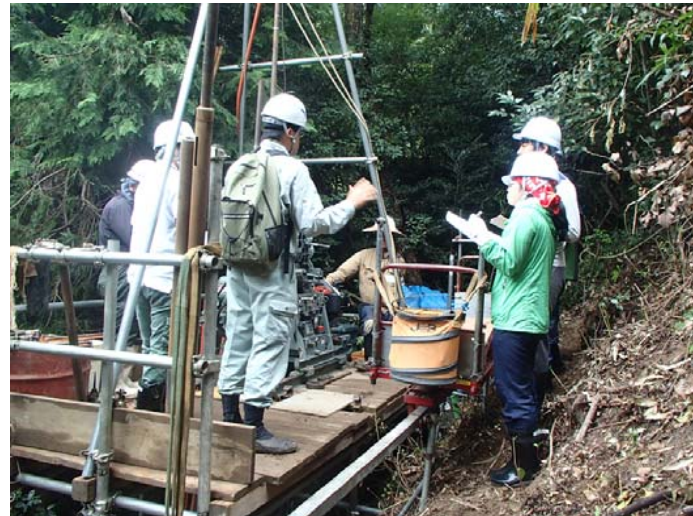
現地視察(倉重地区) 地質調査作業見学