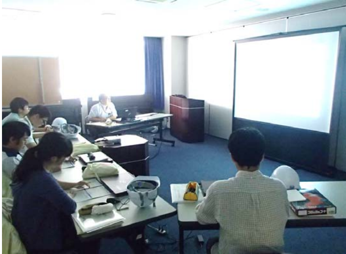
砂防堰堤設計計画(座学) —設計の流れについて—