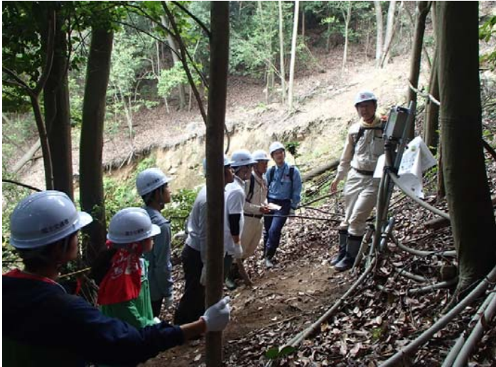
現地視察(八木地区) 斜面観測業務見学