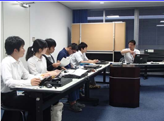
H26・8・20災害概要説明