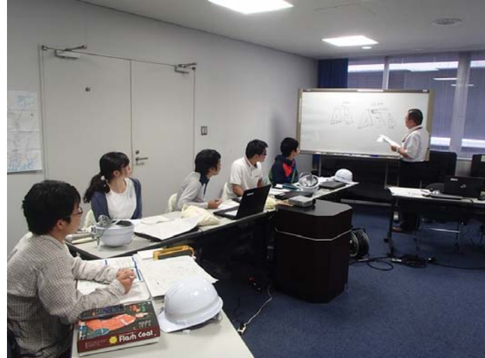
砂防堰堤設計計画(座学) —運搬可能土砂量の計算問題—