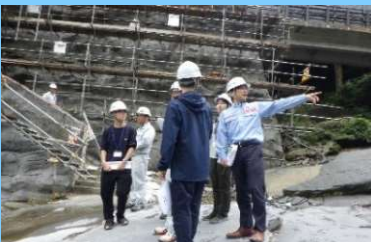
景観に配慮した砂防堰堤の見学