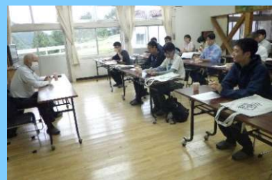
行政関係者との意見交換