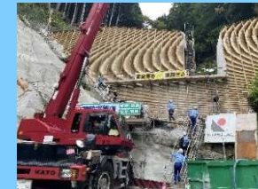
砂防堰堤工事現場見学