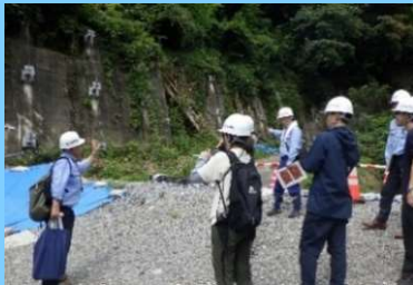
地すべり地区の被害状況調査