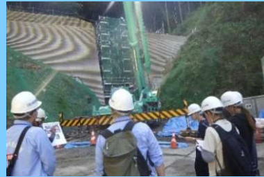
砂防堰堤工事の見学