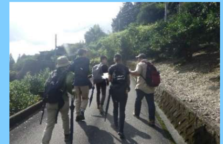
霧石渓谷トレッキング