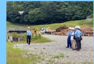
ドローン操作体験