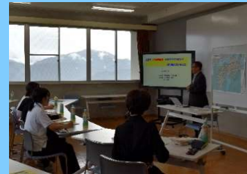
三好市まちづくりの取り組み紹介