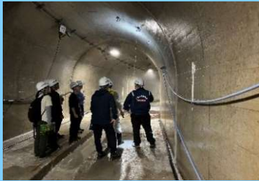
排水トンネル内部の見学