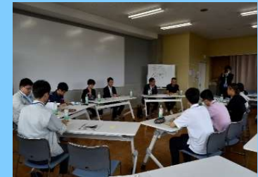
行政関係者との意見交換