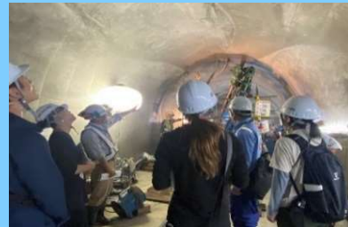
排水トンネル工事現場の見学