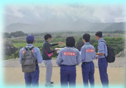
砂防施設等の見学