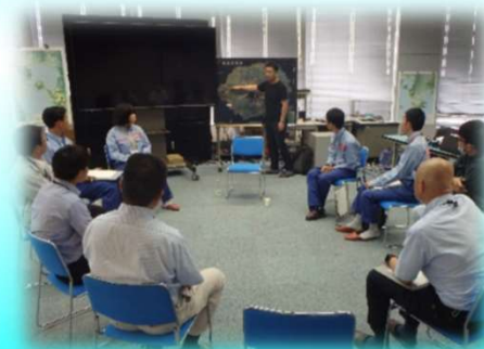
桜島ミュージアムの取り組み説明