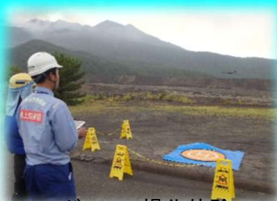
ドローン操作体験