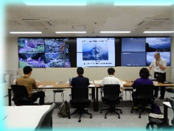
霧島砂防の事業概要