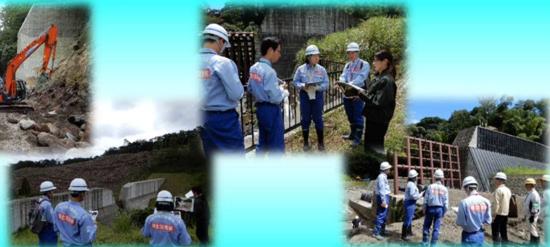
砂防施設、工事現場の見学