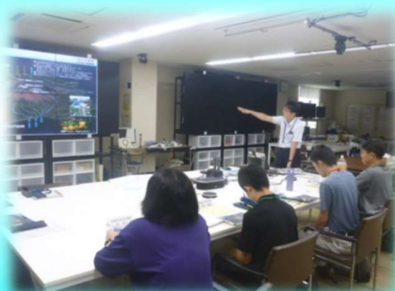
桜島砂防の事業概要説明