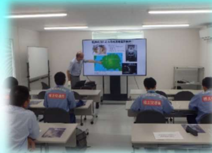
桜島の火山活動状況説明