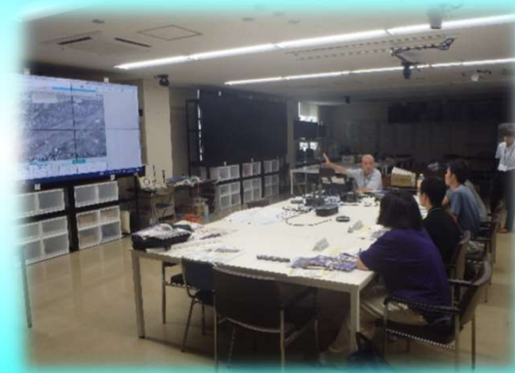
観測機器・防災情報操作(実習)